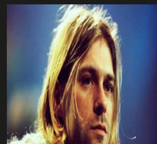
▲ Bijschrift. XXXXX.