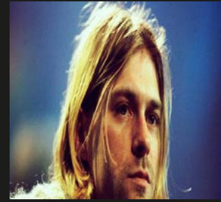
▲ Bijschrift. XXXXX.

Donec eget tincidunt erat. Sed eget consectetur dui, eget faucibus leo. Maecenas nec tristique augue. Curabitur nec mollis libero, at semper ante. Pellentesque habitant morbi tristique senectus et netus et malesuada fames ac turpis egestas. Duis scelerisque ex non consectetur aliquet. Sed fermentum rhoncus risus, a dictum odio ultrices ut. Sed cursus odio elit, vitae auctor diam pulvinar eu. Phasellus at sem in lacus bibendum faucibus vitae sit amet metus. Suspendisse ultricies magna et tellus varius auctor. Maecenas nec vulputate sem. Praesent porttitor, nibh eu porttitor tristique, tellus risus iaculis leo, ut gravida nisi eros ac elit. Cura-