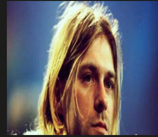
▲ Bijschrift. XXXXX. FOTO XXXX