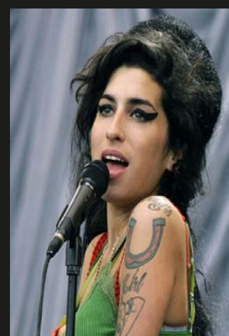
▲ Bijschrift. XXXXX. FOTO XXXX